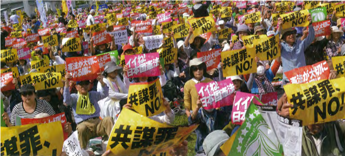
2017年「施行70年、いいネ！日本国憲法5・3集会」5万5000人参加(東京・有明防災公園)