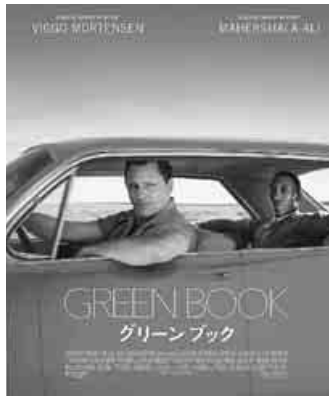
対照的な2人はアメリカ南部で奮闘