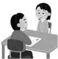
面接へとダッシュ。

30代後半の私は、子育ても終盤で張り切って仕事探しをしていると、求人広告で興味ある業種が目につきました。そのまま