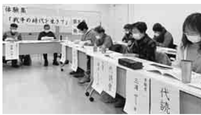
発表会では寄稿者全員(代読含む)が朗読

戦争の時代に生き体験した様々など、証言を後世に伝える「戦争の時代を生きる」第8集発表。懇談会が、宮古・下閉伊地域の戦争を記録する会の主催で12月17