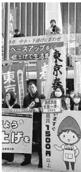
24春闘をスタートする宣言行動

1月12日全労連、国民春闘共闘委員、東京春闘共闘会議は、厚生労働省前まで24春闘の「闘争宣言行動」を行い、経団連前までデモ行進。経団連前では500人が結集し国民春闘をスタートさせ