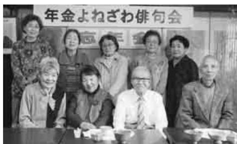
俳句を忘れての忘年会で楽しいひとときを

で忘年会を開きました。「俳句のことは忘れて楽しんでみましょう」の挨拶に続いて乾杯。 「みんな揃ってよかったね」「俳句やって本当によかった」とか「若い