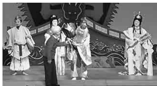
拍手喝采の中、熱演の俳優さんに花束を贈呈

前進座一月公演はさすが専門家の皆さん、声の張りも良く隔々まで聞かせていました。近畿6府県だけでなく、中国地方からも四国からも多くの方々が来られました。ご苦勞さまでした。 芝居は面白かったので、ただ残念なのは出演の女優さんが少ないのは仕方ないのですか。(歌舞伎はそんなもので) 七福神の踊りは面白かったです。良い悪いは別にかしく楽しく見せてもらいました。良い悪いは別にして、もっとも神様に願いを聞いてほしいと思いました。年金を上げてほしいとか、こんな世の中せめて神さんだ 前座は面白かったので、ただ残念なのは出演の女優さんが少ないのは仕方ないのですか。(歌舞伎はそんなもので) 七福神の踊りは面白かったです。良い悪いは別にかしく楽しく見せてもらいました。良い悪いは別にして、もっとも神様に願いを聞いてほしいと思いました。年金を上げてほしいとか、こんな世の中せめて神さんだ