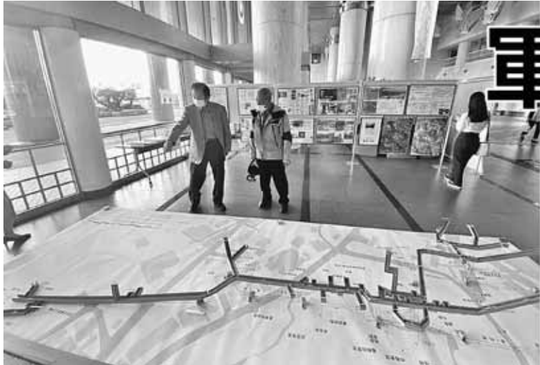
展示された首里城地下の司令部壕模型(長さ5m、100分の1縮尺) 二昨年12月、沖縄県庁で

〒170-0005東京都豊島区南大塚1-60-20天翔大塚駅前ビル 発行人 杉澤 隆宣 月刊1部100円(組合費に含む) 昭和57年6月30日第三種郵便物認可