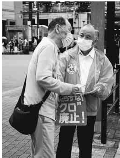
年金減らすな宣伝、相談や対話も—東京・大塚

資料：厚生労働省「国民生活基礎調査」(令和元年)(同調査における平成30(2018)年1年間の所得) (注1) 高齢者世帯とは、65歳以上の者のみで構成するか、又はこれに18歳未満の未婚の者が加わった世帯をいう。 (注2) 等価可処分所得とは、世帯の可処分所得を世帯人員の平方根で割って調整したものをいう。 (注3) その他の世帯とは、全世帯から高齢者世帯と母子世帯を除いた世帯をいう。