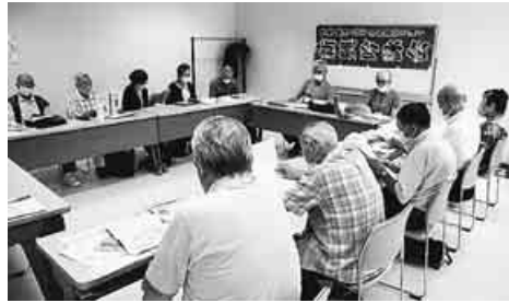
例会で日本国憲法を吟じる新興吟詠会東京支部の皆さん

年金者組合の仲間も参加する新興吟詠会東京支部(2018年10月結成)は、日本国憲法を大事にと「第9条」を吟じ、社会の進歩と平和に貢献したいと親睦を深めています。