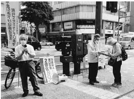
年金署名102筆集まった—福岡県

添えてくれた46人全員が、怒りを込めながら「できない」にシールを貼りました。 またこの宣伝行動のなか、訴えに賛同した女性もその場で入会し、宣伝行動も参加しました。