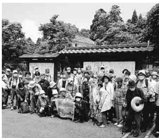
牧場主の工夫と苦勞の酪農経営も聞く お勉強が目的の旅です

5月22日、支部恒例 の春の日帰りバス旅行 が3台で55人の参加。 福井県勝山市の、神仏 習合で栄えた白山信仰 の聖地平泉寺へ。苔む した参道を歩きました。