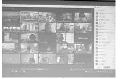
オンラインで参加・発言