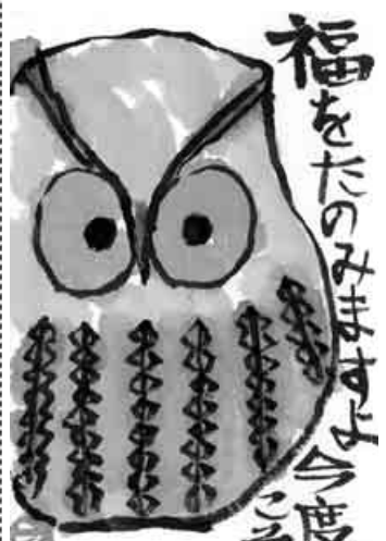
北海道・岩見沢市 細野 悦子