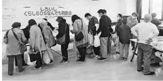
無料提供に並ぶ人たち

「5月4日、札幌市しろいしSOSなんでも相談会実行委員会主催の「しろいし・くらしSOSなんでも相談会、助けあい市場」が開かれました。午前9時の助けあい市場（食料品無料提供）には