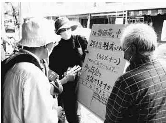
生活できるのシール貼る—新潟・新津