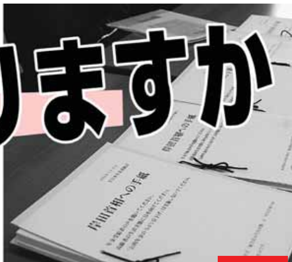
寄せられた「首相への手紙」には悲痛な叫びが……

全国から1400通を集約、記者会見しました。中央本部には「その通りだ、年金者組合に入りたい」「頑張って」の電話が相次いでいます。(2面に関連記事)