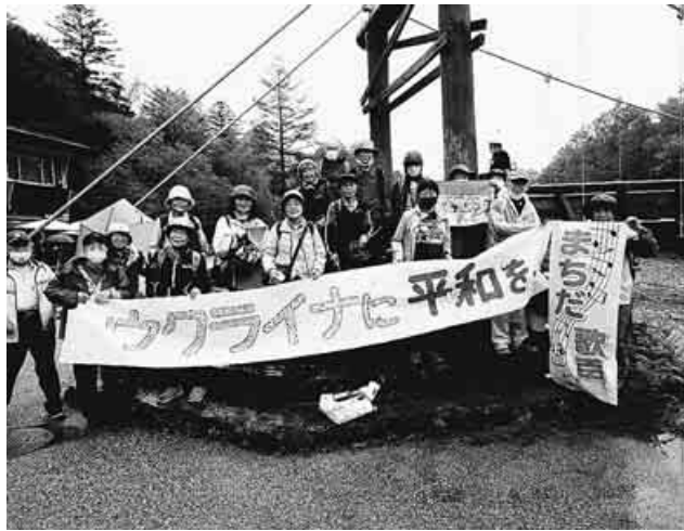
河童橋で「ウクライナに平和を」とアピール