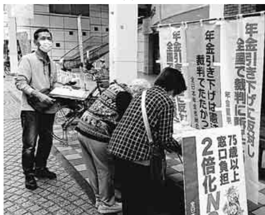
若者との対話も弾んだ—山口