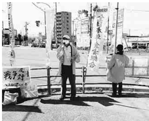
年金減額に怒り、署名は広がる—北海道

年金削減の合理性は、他に方策はなかったのかなど、審理を尽くすのは裁判所の責務です。