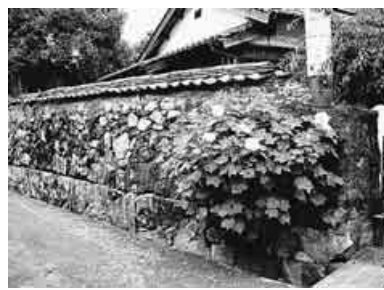
城下町に生活感も