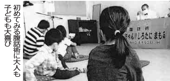
初めてみる腹話術に大人も子ども大喜び

今回の食料品提供には各団体、個人からの寄付、また農民運動全国連合会からの米、製パン会社からのパンの提供もありました。募金は、年金者組合白石支部の1万円をはじめ多くの団体と個人から8万6000円余りが寄せられました。