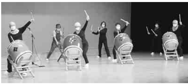
勇壮な和太鼓演奏

加者は23支部、217人でした。舞台出演には12グループが参加し、ロビーでの展示は11支部が出展です。