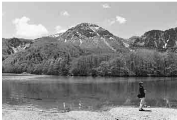
大正池から見た焼岳