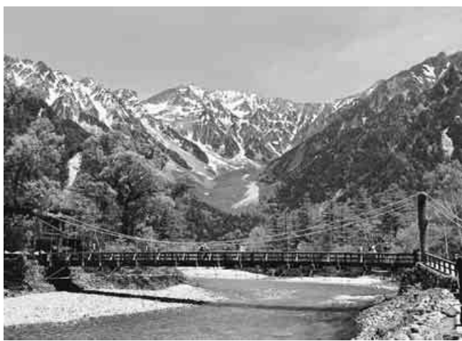
シンボルともいわれる河童橋と穂高連峰