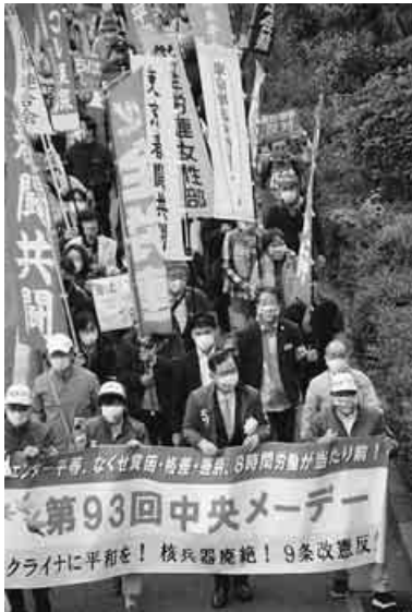
中央メーデーデモ行進

「なくせ貧困と格差 大幅賃上げ・底上げで景気回復 地域活性化」 「ロシアのウクライナ軍事侵略糾弾」「敵基地攻撃能力の保有反対、憲法9条を守れ STOP! 戦争する国づくり」「ジエンダー平等」などをかけ、今年も全国200カ所以上でメーデーが開催され、年金者組合の間も参加しました。