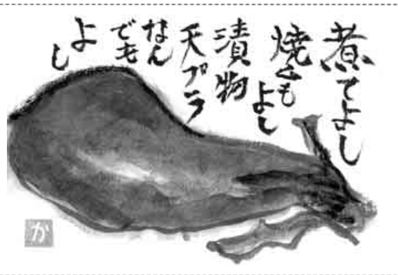
兵庫・明石市 高塚 かつ枝