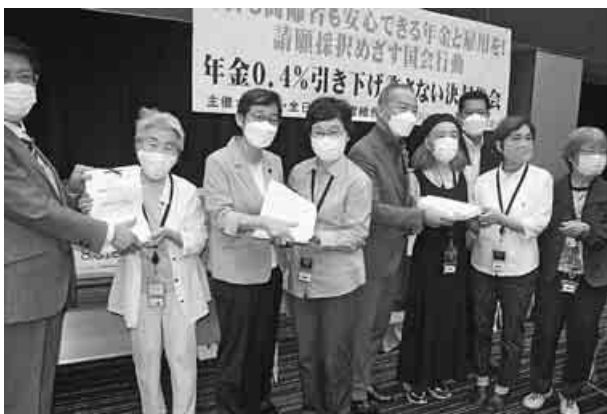
国会議員に署名を手渡す