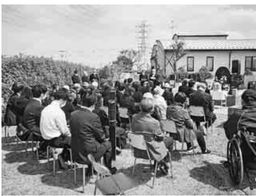
8カ所の墓所を持つ埼玉県本部をはじめ、年金者組合ではこ