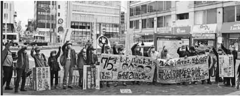
奈良県本部の4月15日JR王寺駅南口での宣伝行動。用意したビラ100枚を20分でまき、コピーの100枚もまき切りました。(加藤勇)

今日そちら様のチラシを見て、どれほど勇気づけられたことか。自分もシルバー人材センターで働いていますが、最低の賃金です。中には、早朝のトイレ掃除2時間というきつい条件なのに時給900円、一月(20日)働いても3万6000円という人もいます。こういう高齢者を助けるという考えのない指導者がまかり通っている日本です。そのような中で高齢者のために頑張っている組織があることを知り、いくらか元気が出ます。何もできない貧乏人ですが、応援しています。 「国民年金のお知らせ」がきましたが、実家へ毎月の仕送りもあり、加入する余裕はありませんでした。兄も姉も加入できず無年金未加入でした。