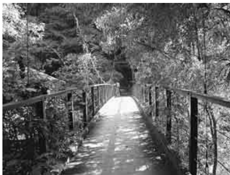
吊り橋の鳩ノ巣小橋