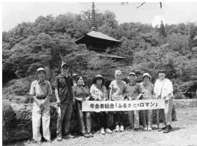
「さすが、まほろばの里」、コロナを忘れた楽しいひととき

川内溪谷の紅葉 青森・むつ支部 10月23日、7人で、 土日限定のダムカレー を賞味。市営の温泉に 浸かって疲れを癒しま した。(柳弥睦夫)