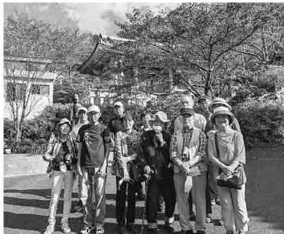
梨狩りの帰路、お里沢市で名高い壺阪寺へ

大天梨をゲット 奈良・河合支部 10月9日、よく晴れ た土曜日、13人で「梨 狩りと壺阪寺拝観」の 阪寺を拝観。英気を養 った一日でした。(馬場隆雄)