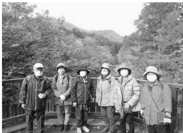
川の両側約1.3キロ、赤や黄色に染まった道を散策

川内溪谷の紅葉 青森・むつ支部 10月23日、7人で、 土日限定のダムカレー を賞味。市営の温泉に 浸かって疲れを癒しま した。(柳弥睦夫)