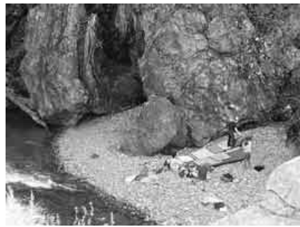
▲ロッククライマーも ▲巨岩奇岩と清流

鳩ノ巣の駅舎の外に出ると、もうすでに空気が変わっていた。天高く蒼い空、風に揺れる山の木々、とろけそうな秋の日差し。そう、東京とは思えない空間がそこには広がっていた。