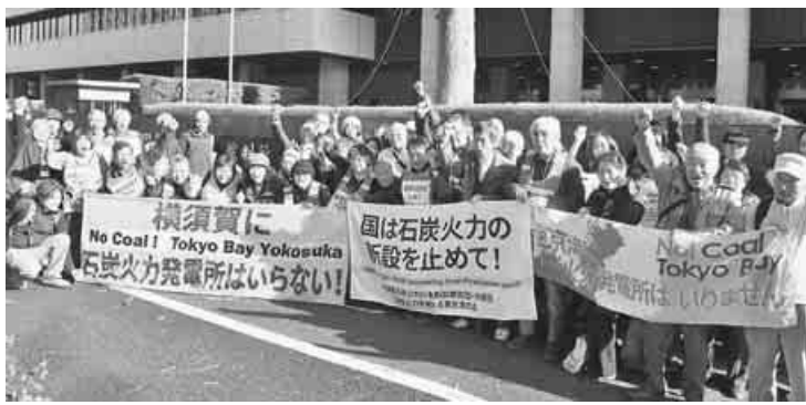
東京地方裁判所前で

神奈川県横須賀市の久里浜には1960年代からの石油を燃料とする東洋一と言われた発電所があり、2000年代には老朽化でほとんどが停止状態になっていました。2016年に石炭を燃料とする発電所にリプレイスする計画が持ち上がり、2019年、地域の住民は「今頃なんで石炭なのか」、「公害の再来はダメ」と反対運動に立ち上がり、パリ協定が成立したときでもあり、世界の流れに逆行す