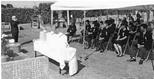
秋の慰霊祭と納骨の儀

私も消えることはありませんが、元気で前を向けるのは、声をかけ肩をたたき、背中を押してくれる家族、仲間たちに助けられているからです。私たちが家族は、夫と娘の夫、弟の3回の葬儀を私たちの共同墓、殿山聖地墓苑の葬儀部にお願いしました。途方に暮れる遺族に寄り添って故人の生き方や遺志を汲み取り、葬儀に掛かる一切を取り仕切ってくださいました。何でも相談して誠に感謝しています。