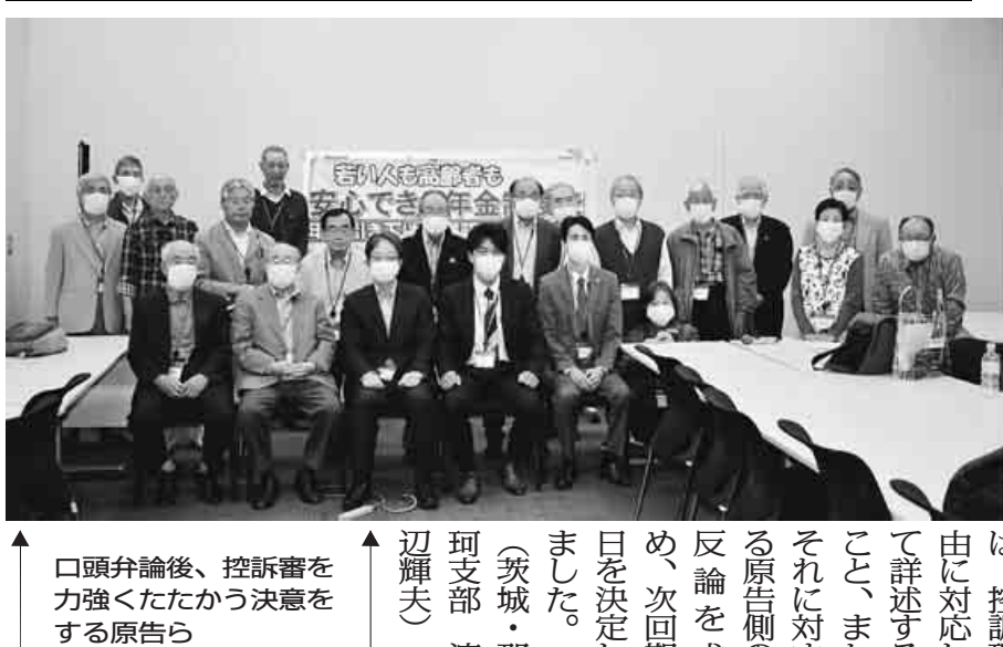
口頭弁論後、控訴審を力強くたたかう決意をする原告ら

被告・国の答弁書は、わずか8行、「原告における被控訴人の答弁書および各準備書面のとおりであり、原判決の判断は正当である。控訴の理由がないから、棄却されるべきである」です。これに対して裁判長は、控訴理由に対応して詳述すること、またそれに対する原告側の反論を求め、次回期日を決定しました。