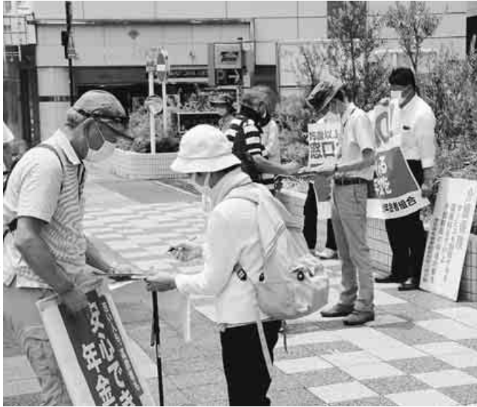
「安心できる年金を」と訴えた和歌山駅前での宣伝(6月15日)

(全国弁護士共同代表)が財政問題、マクロ経済スライド問題など、1時間30分にわたって尋問し、山家先生は明快に答