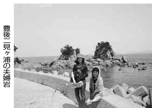
豊後 見ヶ浦の夫婦岩

明治の文豪・国木田独歩は佐伯の城下町に下宿した。「海面、湖水の如し。湖面寂々たり」と記す入り江は漁場の賑わいに反してとても静か。