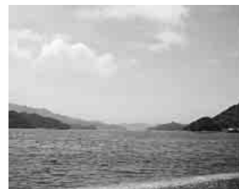
遠方に島々が連なる