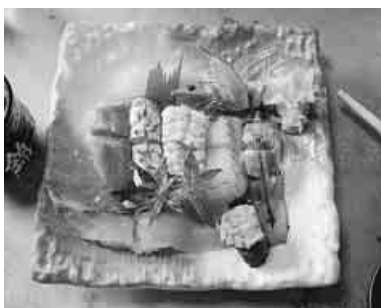
半分に切られたネタの大きな握り寿司

文豪たちの心に映ったものを感じると、訪れた人は、しんと佇んでしまう。佐伯の海にはそんな