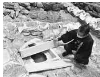
湯壺の源泉は透明