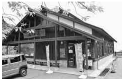
年間9万人利用の「あったか湯」

東の空に太陽が顔を出したのは午前4時20分。窓を開けると、カッコウ、カッコウ……近くの森からカッコウのよく通る鳴き声が聞こえます。鳥たちの朝は早く賑やかです。