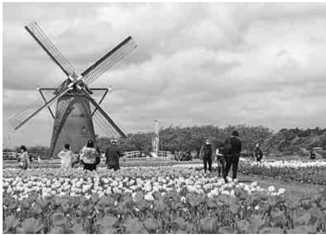
7000歩、被爆アオギリ2世の木陰と冷たいバラ茶の味が忘れられない