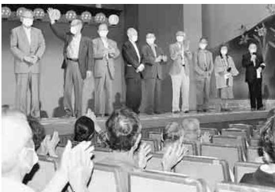
花道に並んで紹介される参加各員本部長

前進座5月国立劇場公演の観劇会が5月14日と17日に行われました。昨年、感染症対策を万全のために中止を余儀なく