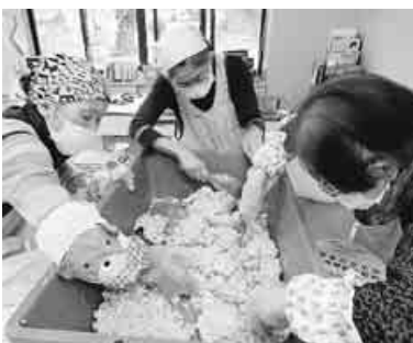
教わった通りに混ぜる

4月14日、念願の味噌づくりに参加しました。半日くらいで終わるのかと思いきや、午前9時から午後5時まで1日がかりの作業でした。