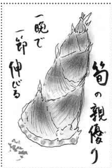
千葉・柏市 藤本 トミ子