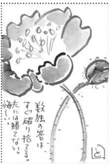
滋賀・甲賀市 奥村 喜代