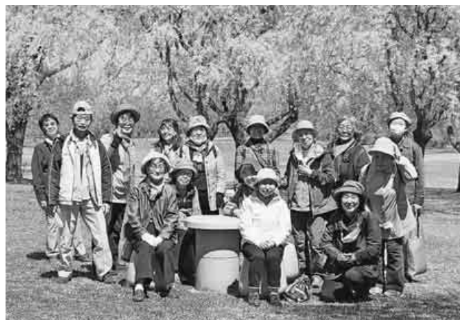
植物園や花木園、山野草園もあり、自粛しつつも桜以外の楽しみも