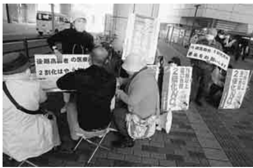
千葉市中央区支部の宣伝

千葉市中央区支部は、昨年夏までは人通りが少ないJR蘇我駅で宣伝を行っていたが、今年からは、