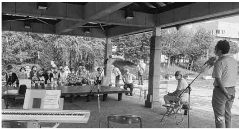
あいさつする福岡新市長

8月6日、被爆75年原爆犠牲者追悼のつどいは、福岡の今池親水公園に同実行委員会の主催で行われ、染に配慮した間隔をあけた椅子席で設営された会場となった香芝市役