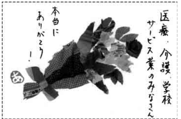
兵庫・神戸市 宇城 明子