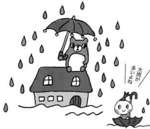
火災共済は火事だけでなく、風水害などでも給付されます

各地で豪雨災害が発生しています。全労連共済の火災共済は、特約なしで住宅火災以外にも床上浸水・大雪・落雷など風水害についてもワイドな保障がついています。助け合い共済だからできる少ない掛け金の大型保障です。台風シーズン前に、ご加入を検討してください。