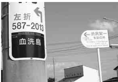
血洗島交差点の住居表示