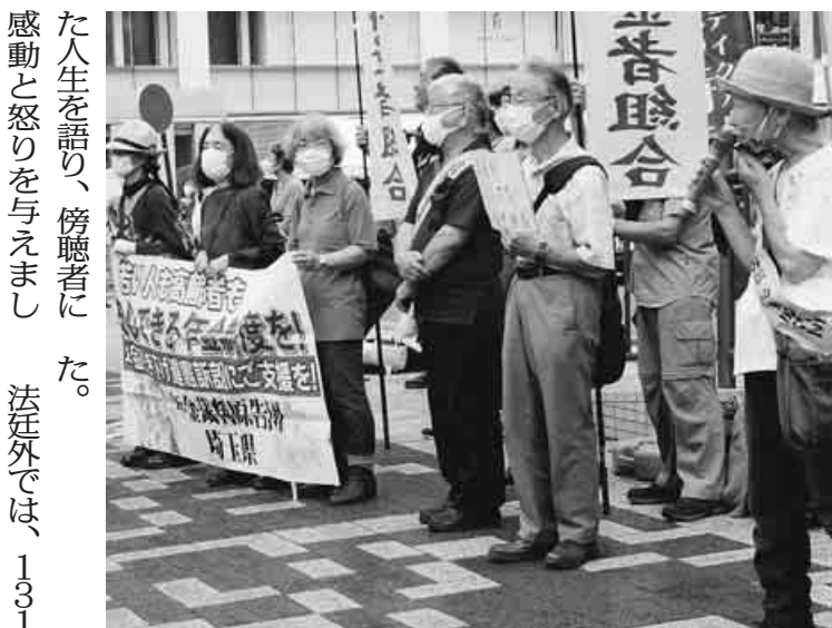
浦和駅前でされた宣伝行動

う意味合いがある。年金制度があることで若者は親を扶養・扶助することから解放されて、自由な生き方を選択ができる。年金削減は若者の生き方を束縛することになる。年金だけでは制圧できない実態の中で社