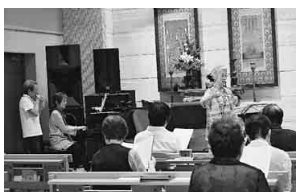
不安がありますが「続ける工夫」を忘れず進め... (田村)