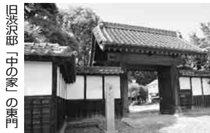
旧渋沢邸「中の家」の東門