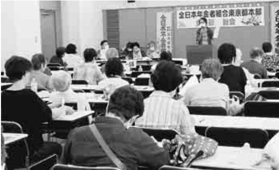
出席者は51人。全員がマスク着用で