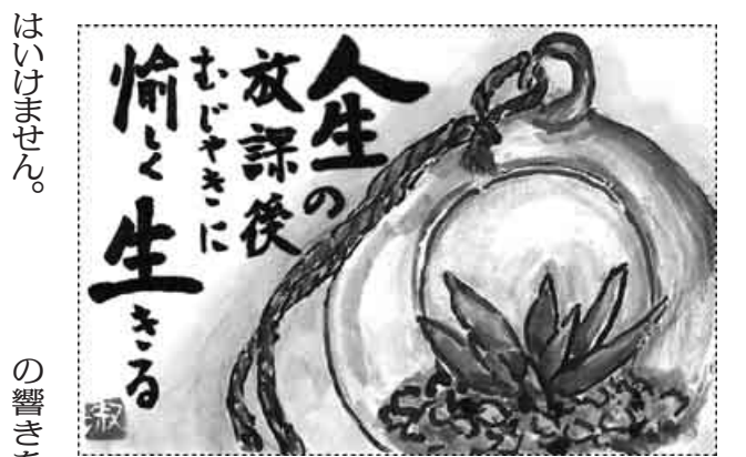
福岡・水巻町 江上 淑子