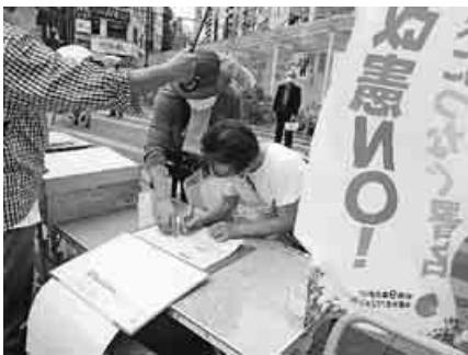
小雨降る大塚駅頭で中央本部、東京都本部の仲間も参加しての憲法守ろうの宣伝行動。「平和憲法は大事ですから」と買い物途中の女性が署名をしてくれました。(7月9日)

町、関川村、弥彦村の6自体、「後期高齢者」は佐渡市、三条市、聖籠町、阿賀町、弥彦村の5自治体の議会で意見書採択されました。9月議会にも提出していきます。