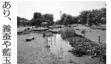
清水川河畔の「青洲公園」