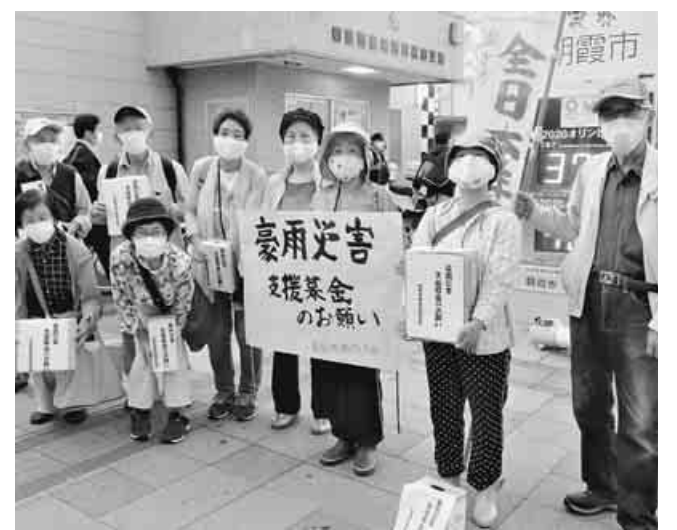
親子連れも募金してくれました

埼玉朝霞が九州救いの街頭募金 埼玉朝霞支部は九州地方の豪雨災害の惨状を黙って見ることができず執行委員会も待たず緊急の訴えを行いました。少し雨の残る7月17日5時に参加した方12人。用意したカンパ箱10個、看板も急いで作り、20523円の貴重な募金を得ました。(木村静恵)