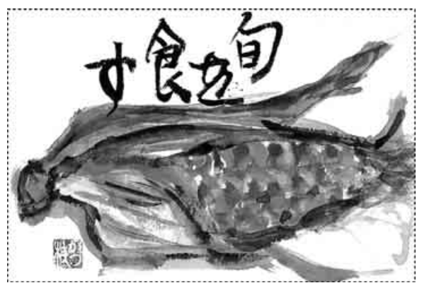
兵庫・明石市 高塚 かつ枝

趣味で尺八を吹いています。若いころ、正月に演奏されていた尺八の音に魅せられて以来、独特の竹