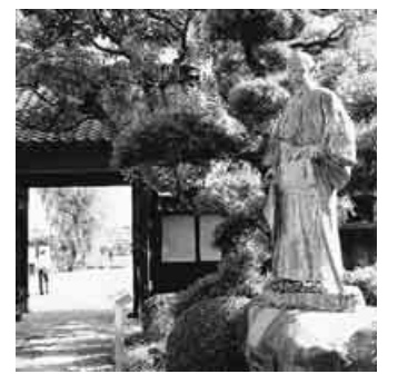
一本刀の渋沢栄一(旧渋沢邸)