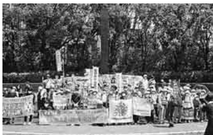
核兵器廃絶めざして

核兵器廃絶を訴えて全国各地をつなぐ「国民平和大行進」が年金者組合も参加して6月28日、長崎市で行われました。被爆者を含む約100人の