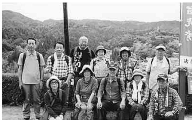
地元の案内人の仲間は「晴れ男」。小雨も上がり、光秀公産湯の井戸にて