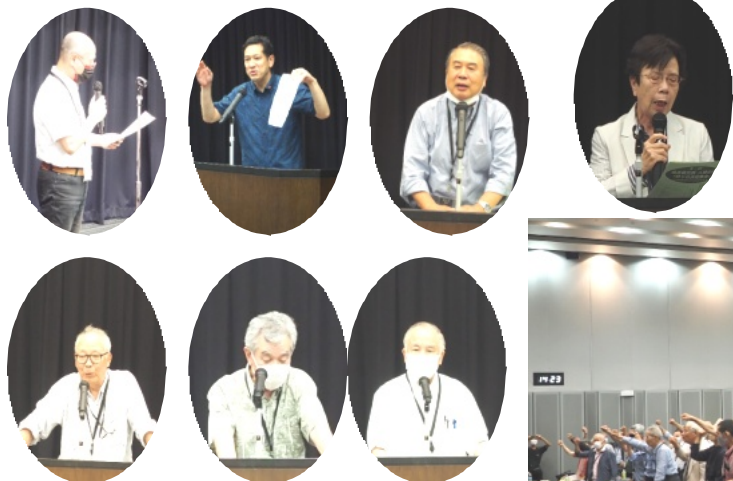
集会での挨拶・中央本部からの提起・アピール提案